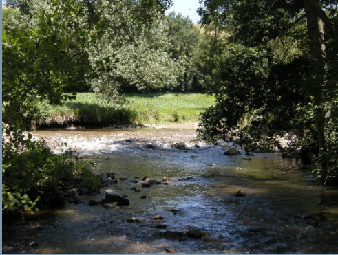
La Chèvre après travaux

Enfin, trois seuils ont été effacés sur la Coise entre juin et juillet 2018 : le seuil de la Chèvre (St Denis/Chevrières), le seuil de la Provote et seuil de la Platte (Chazelles/Chevrières). Cette action s'inscrit dans le cadre du Contrat Territorial afin de restaurer la continuité écologique. Ces travaux ont permis de rouvrir 4,6 km de rivière aux espèces piscicoles et aux sédiments.