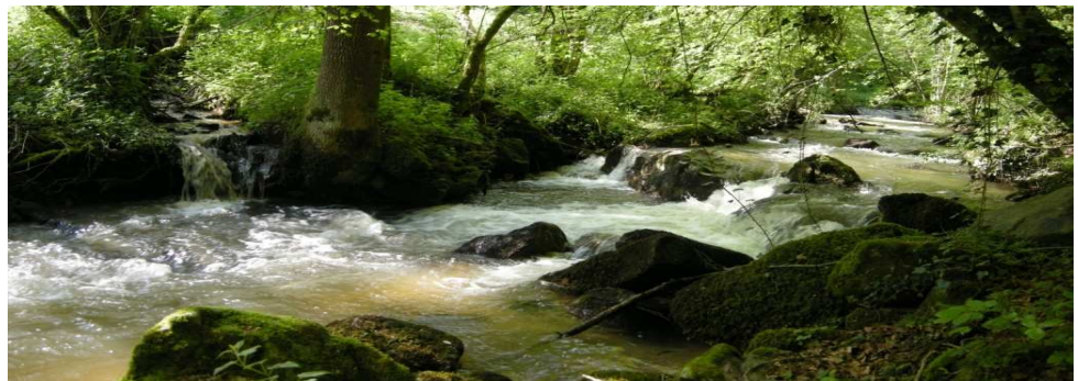
Le Couzon à Coise

Cette année 2013 est charnière pour le programme d'entretien des cours d'eau. Le diagnostic en cours révèle déjà certaines problématiques récurrentes.