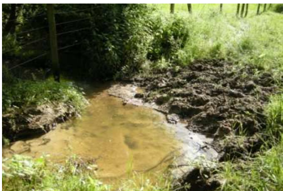
Zone de piétinement sur le Coiset

Lors de cette rencontre, un projet d'avenant d'un an, au deuxième contrat de rivière, sera présenté et soumis à validation.