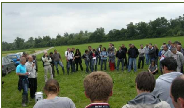
Visite des parcelles avec plus de 150 participants venus de toute la France

Ce voyage a permis d'aborder les problématiques du non-labour, et en particulier du semis direct, et de la biodynamie, pratiquée sur la ferme des Wenz. Le printemps a été tout aussi humide et froid en Allemagne que chez nous, et ces conditions climatiques sont particulièrement préjudiciables en non-labour (présence accrue de limaces notamment, qui ont ravagé les cultures de soja).