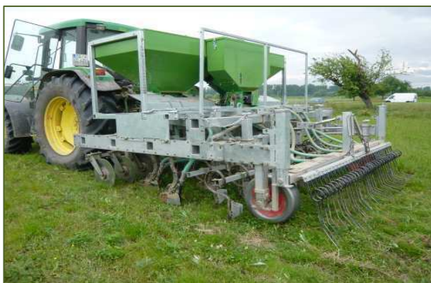
Démonstration de semis direct avec l'Ecodyn

Ce voyage a permis d'aborder les problématiques du non-labour, et en particulier du semis direct, et de la biodynamie, pratiquée sur la ferme des Wenz. Le printemps a été tout aussi humide et froid en Allemagne que chez nous, et ces conditions climatiques sont particulièrement préjudiciables en non-labour (présence accrue de limaces notamment, qui ont ravagé les cultures de soja).