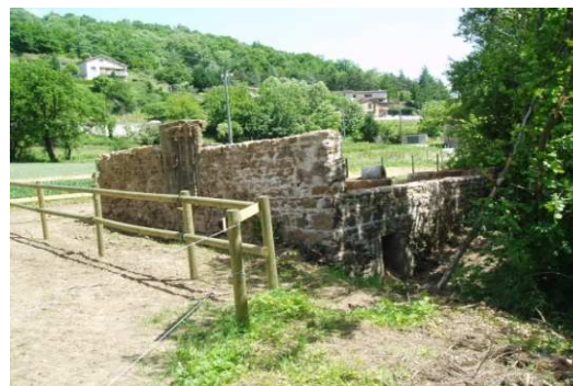
A l'arrière du bâtiment, on distingue la sortie de l'ancien bief

A proximité de l'ancien Moulin du Château, il est possible de découvrir les ruines du battoir à trèfle, appelé « le batou ». Ce bâtiment a été construit sur le bief, au fil de l'eau. La force motrice de l'eau permettait d'actionner la meule courante sur la meule gisante et ainsi d'écraser les fleurs des trèfles pour en extraire la graine.