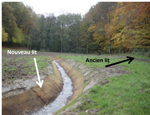
Vue du nouveau lit depuis l'aval

Le nouveau lit, ainsi calé ne présente aucune chute mais une succession de petites ruptures de pente. Cette phase signe la fin des travaux et un suivi régulier nous permettra de constater avec le temps l'amélioration de la qualité de l'Arbiche.