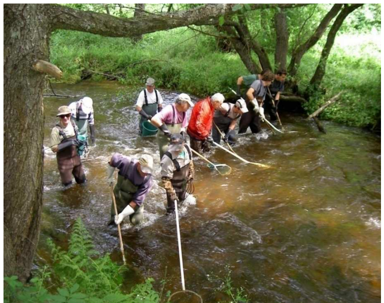
Pêche électrique d'inventaire piscicole

Le même type de protocole va voir le jour sur la partie Rhône du bassin. Les premiers résultats sont attendus pour fin 2014.