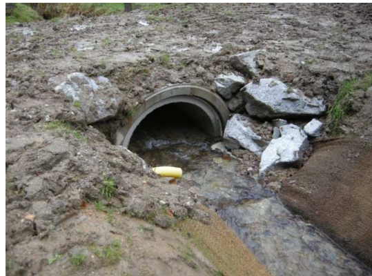
Vue du passage busé depuis l'amont