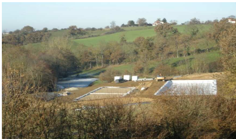
La nouvelle station « filtre planté de roseaux » en travaux

Les travaux ont été confiés à l'entreprise SADE. Cette dernière assure le terrassement et la mise en place du réseau de collecte, la création des bassins et la mise en œuvre du système d'assainissement de type «filtres plantés de roseaux ».