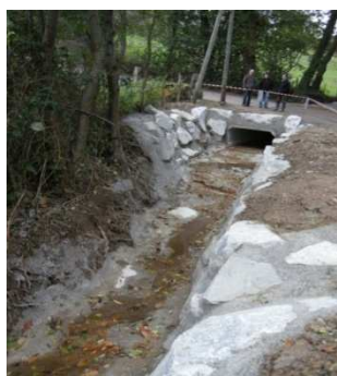
Le ruisseau en bordure de route

La commune et le SIMA se sont partagés les interventions en fonction des compétences de chacun pour faire en sorte que lors d'évènement pluvieux importants, le ruisseau puisse passer sous la voie communale sans tout entraîner sur son passage.