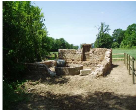
Le battoir avec ses deux roues

La commune de Bellegarde en Forez, après plusieurs mois de travail avec les riverains, a créé un sentier de randonnée sur les berges de l'Anzieux. Ce sentier qui démarre à proximité du parking du terrain de football, va longer la rivière jusqu'à la voie ferrée qui mène à la carrière. Long de 850 mètres linéaires, il va permettre de rejoindre le sentier botanique de Saint Pierre. Tout au long du parcours, les promeneurs pourront découvrir la rivière, sa faune, sa flore, mais aussi le patrimoine bâti.